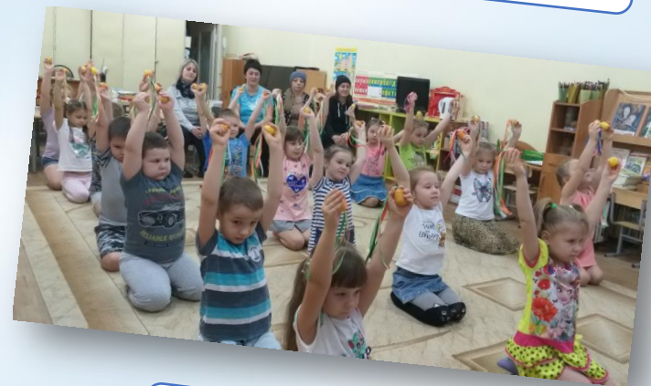
День открытых дверей «Утренняя гимнастика»