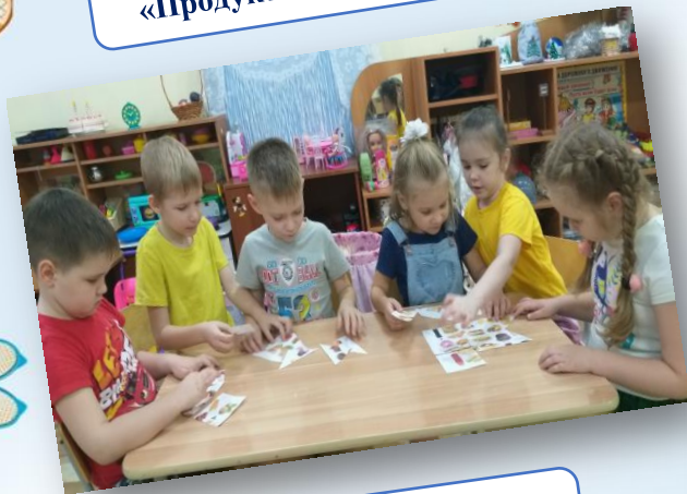
Дидактическая игра «Продукты питания»