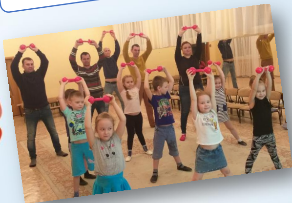
Заседание детско-родительского клуба «Здоровейка»