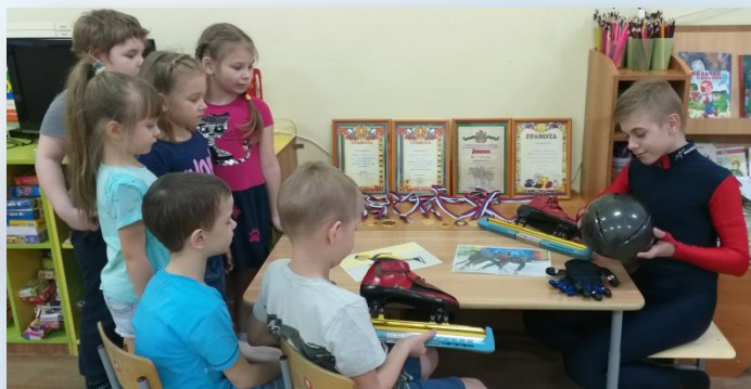
Знакомство с видами спорта