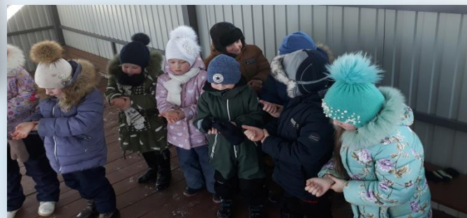
Игра – экспериментирование «Сосчитай пульс»